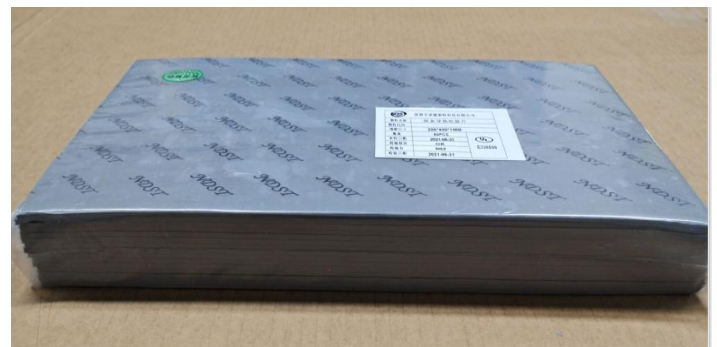
把产品装入 PE 胶袋, 并贴上内标签