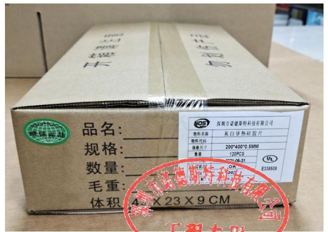
装箱, 并贴上外标签及 ROHS 标签后封箱