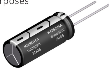
ΦD < 13mm