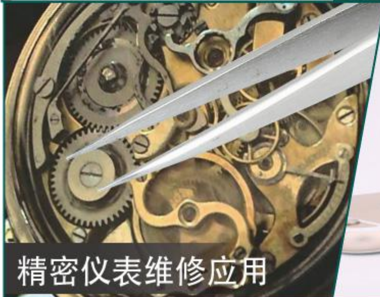
精密仪表维修应用