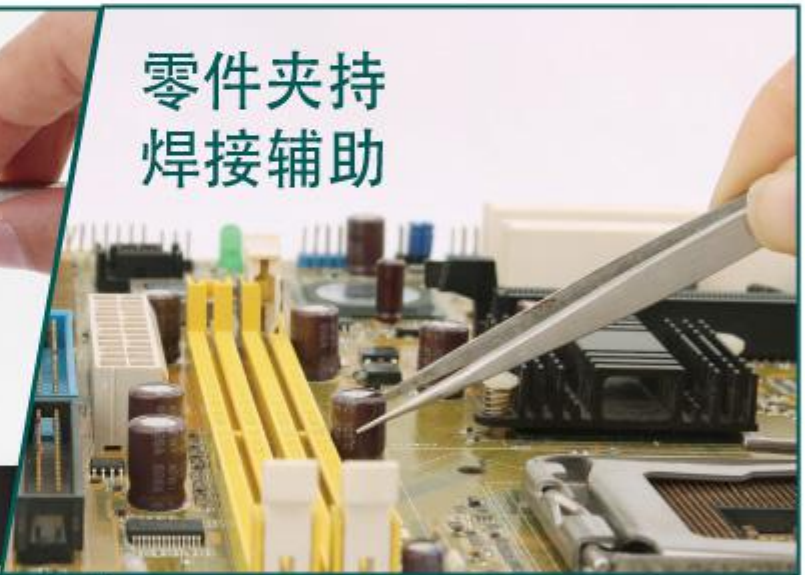
零件夹持 焊接辅助