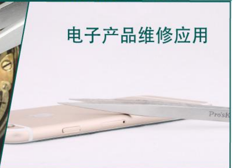
电子产品维修应用