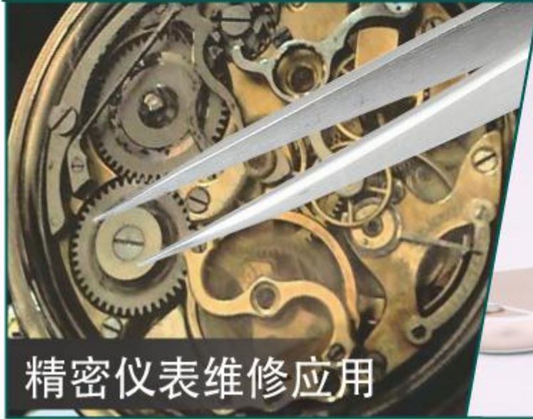
精密仪表维修应用