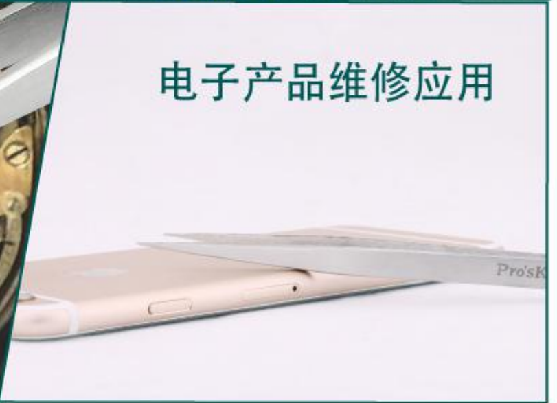
电子产品维修应用