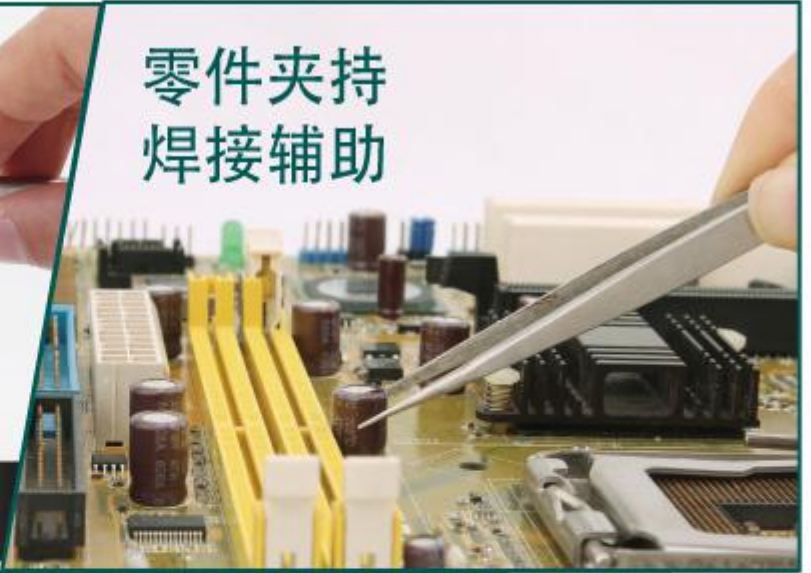
零件夹持 焊接辅助